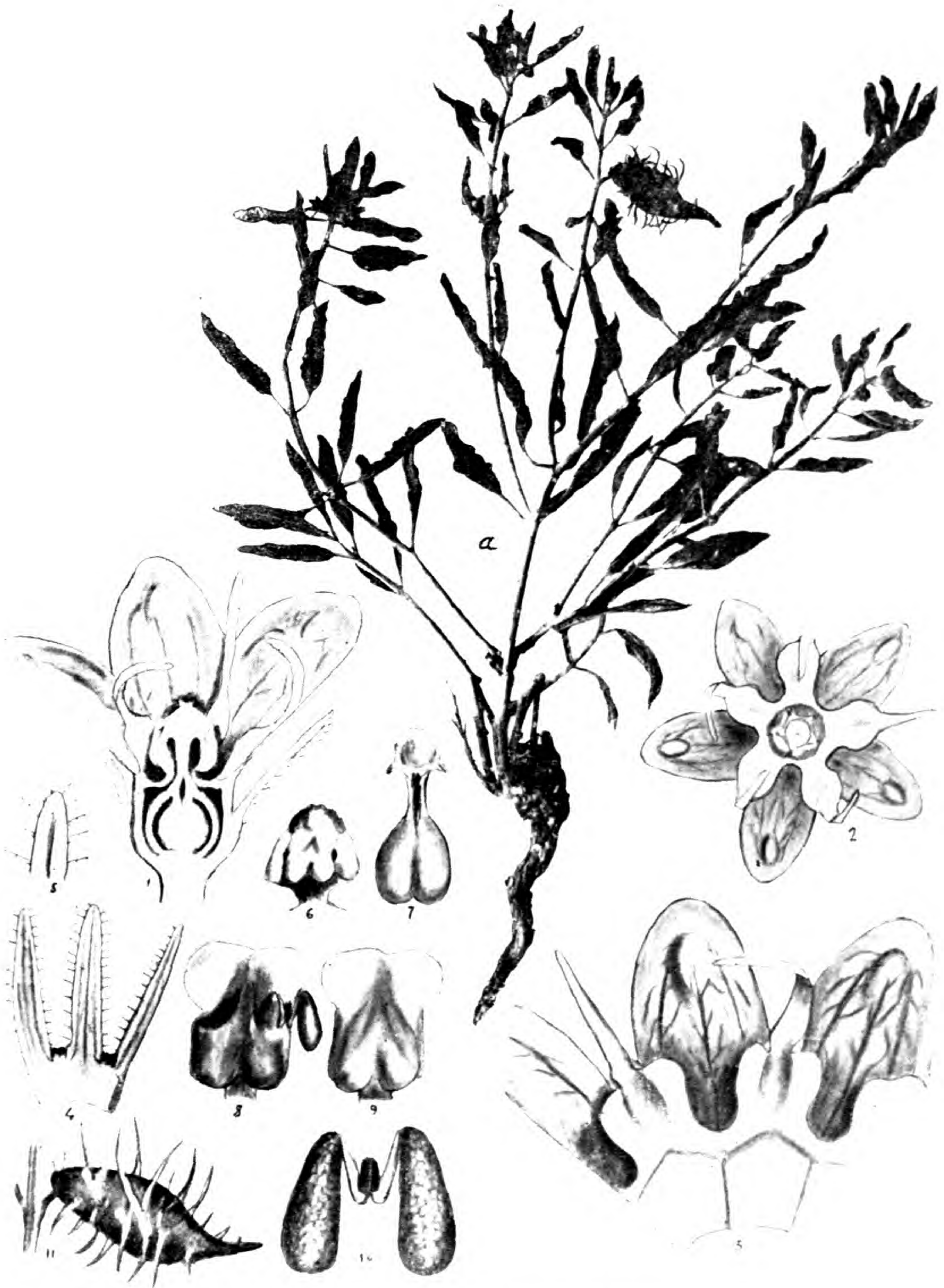
Glossonema Gaultieri Ball. et Trab.