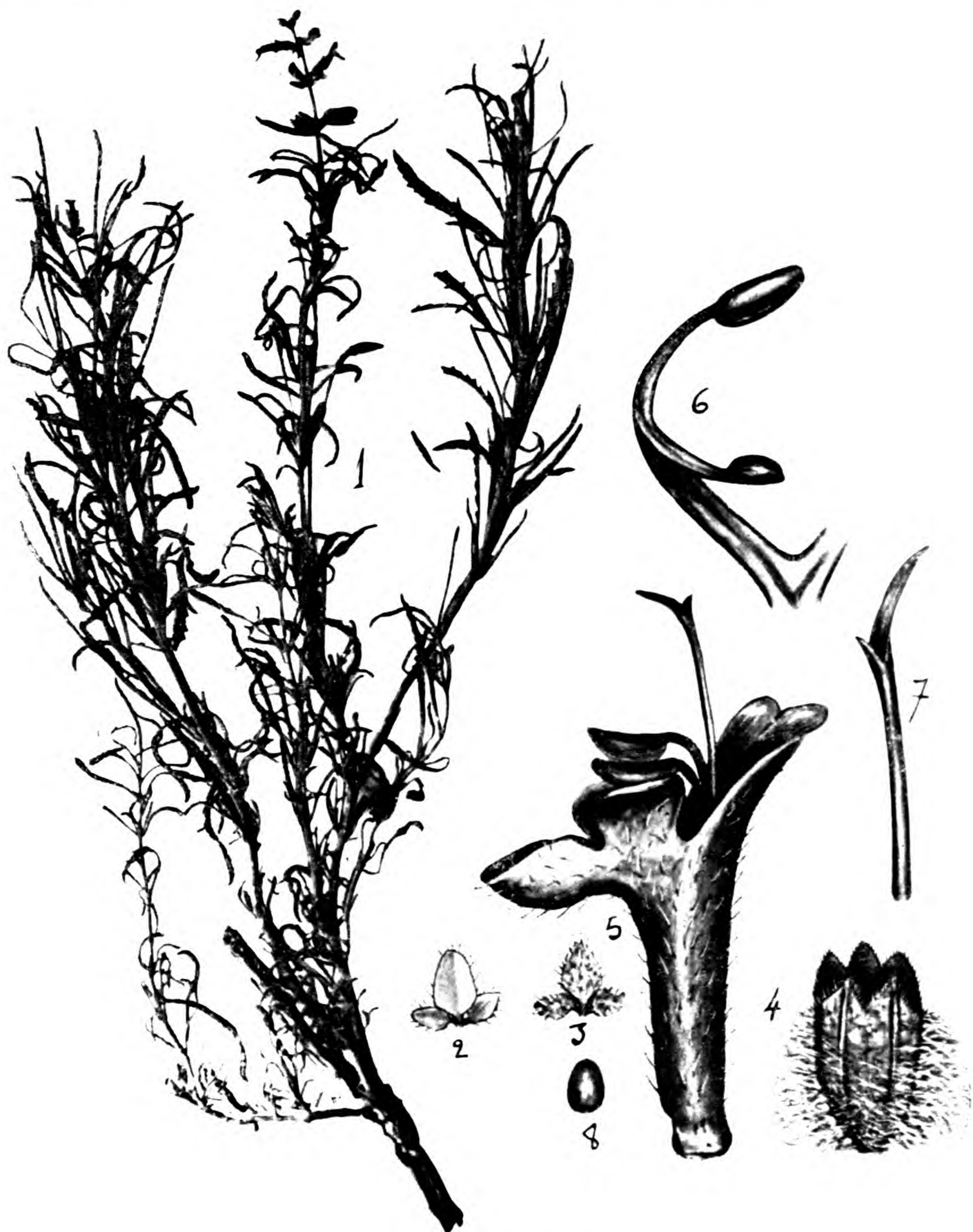
Salvia Chudawi Batt. et Trab.